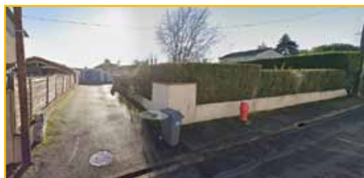
Secteur convoité entre les rues de Vouneuil, des Joncs et l'avenue du 8 mai 1945.