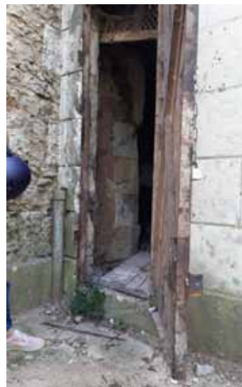
Seul accès villa